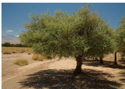
Tusca (Acacia aroma)