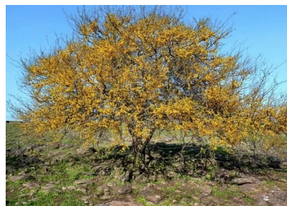
Aromita / Espinillo (Acacia caven)