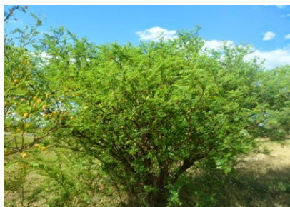
Vinal (Prosopis ruscifolia)